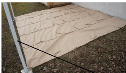
Ourlet côté gouttière

Positionnez sur le sol votre toile de telle façon que l'ourlet de la toile se trouve sous l'emplacement de la gouttière.